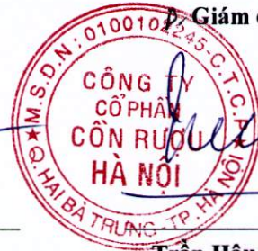
Trần Hậu Cường