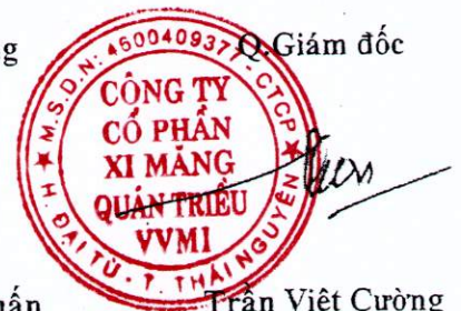
Trần Việt Cường