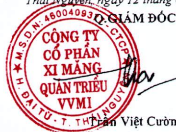
Trần Việt Cường