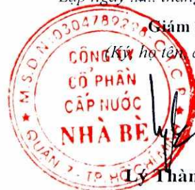
Lý Thành Tài