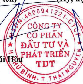
CHỦ TỊCH HĐQT Lưu Chuyên