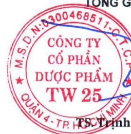
TSC Trịnh Việt Tuấn