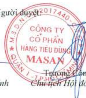
Trương Công Thắng Chủ tịch Hội đồng Quản trị

Các thuyết minh đính kèm là bộ phận hợp thành của báo cáo tài chính riêng này