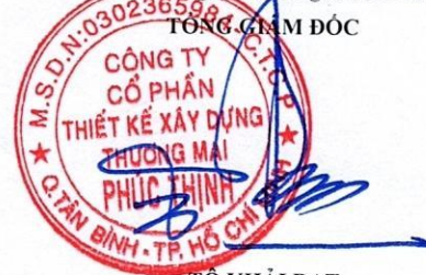
TỔ KHAI ĐẠT