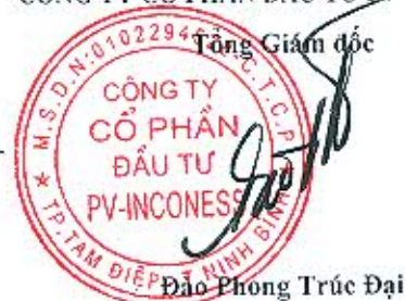
Đào Phong Trúc Đại