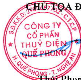
Thái Phong Nhã