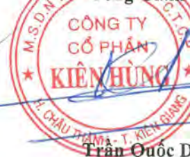
Trần Quốc Dũng