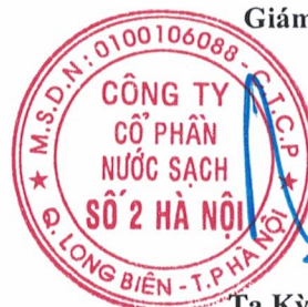
Tạ Kỳ Hưng