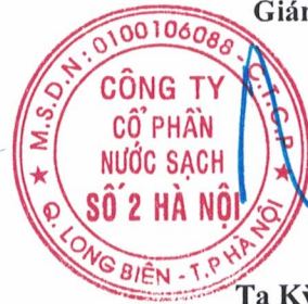
Tạ Kỳ Hưng