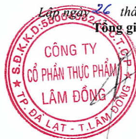
Đỗ Thành Trung