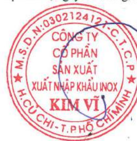
Đỗ Hùng Chủ tịch Hội Đồng Quản Trị