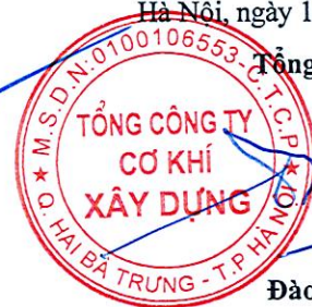
Đào Đức Thọ