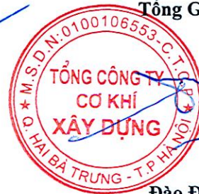
Đào Đức Thọ