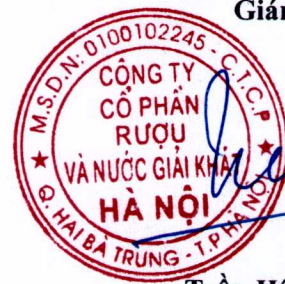
Trần Hậu Cường