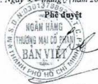
Lý Công Nha