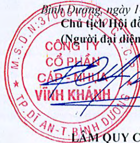
LÂM QUY CHƯƠNG