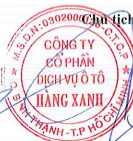
ĐỖ TIẾN DŨNG