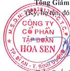
Trần Quốc Trí