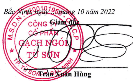
Trần Xuân Hùng