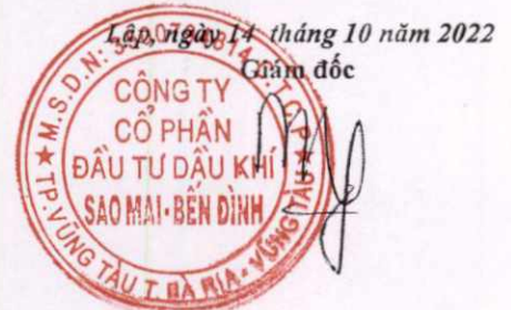
Phùng Như Dũng