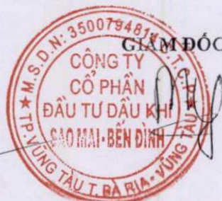
Phùng Như Dũng