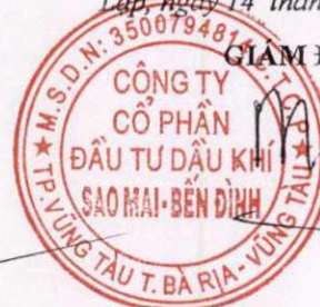
Phùng Như Dũng