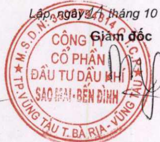
Phùng Như Dũng