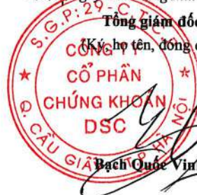
Bạch Quốc Vinh