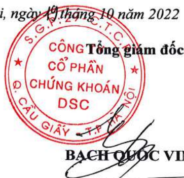
BẠCH QUỐC VINH