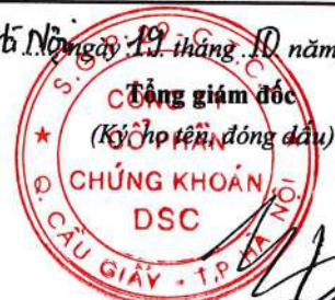
Bạch Quốc Vinh