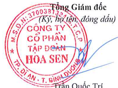
Trần Quốc Trí