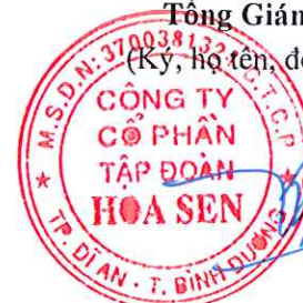
Trần Quốc Trí