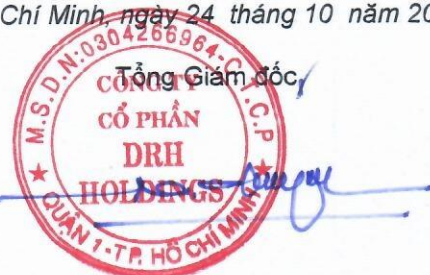
Ngô Đức Sơn