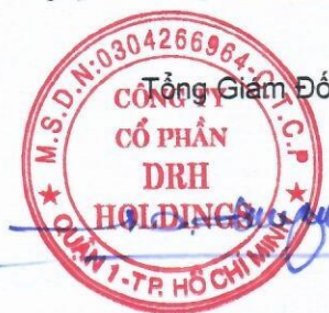
Ngô Đức Sơn