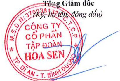
Trần Quốc Trí