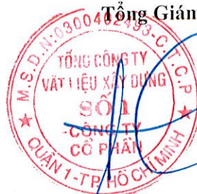
Cao Trường Thọ