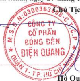
Hồ Quỳnh Hưng