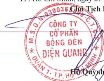
Hồ Quỳnh Hưng