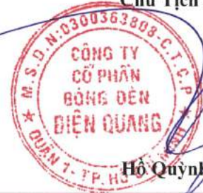
Hồ Quỳnh Hưng