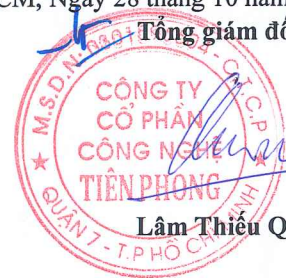
Lâm Thiệu Quân