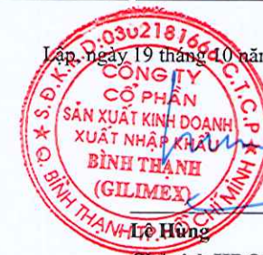
Chú tịch HĐQT