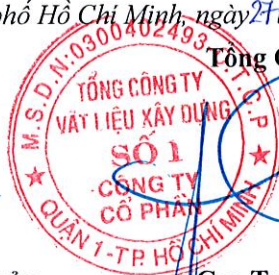
Cao Trường Thụ