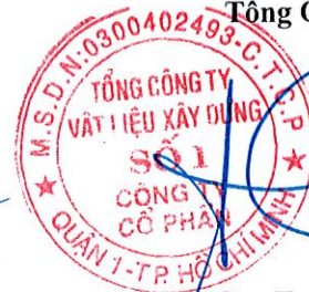
Cao Trường Thụ