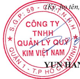
YUN HANG JIN

Chủ tịch Hội đồng thành viên (Ký, họ tên, đóng dấu)