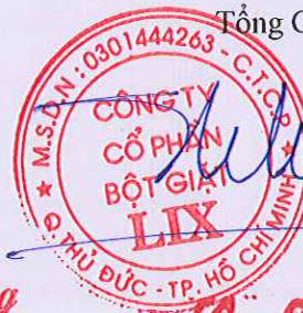
Cao Thành Tín