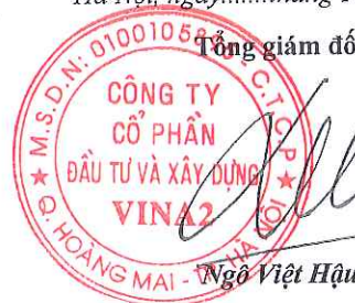
Ngô Việt Hậu