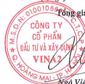
Ngô Việt Hậu