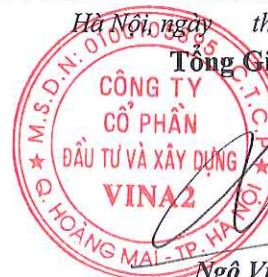
Ngô Việt Hậu