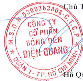
Hồ Quỳnh Hưng