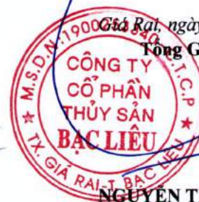
TRẦN CHÍ NAM