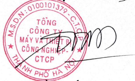
Trần Quốc Toàn