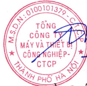
Trần Quốc Toàn