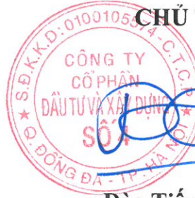
Đào Tiến Dương