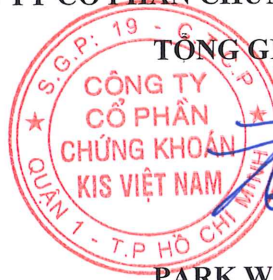
PARK WON SANG