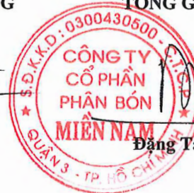
Đặng Tấn Thành