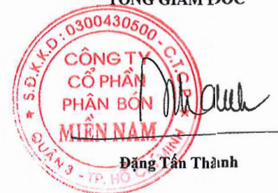
Đặng Tấn Thành