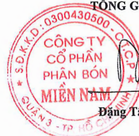
Đặng Tân Thành