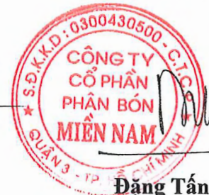
Đặng Tấn Thành