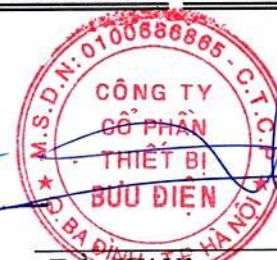
Trần Hải Vân Chủ tịch Hội đồng quản trị