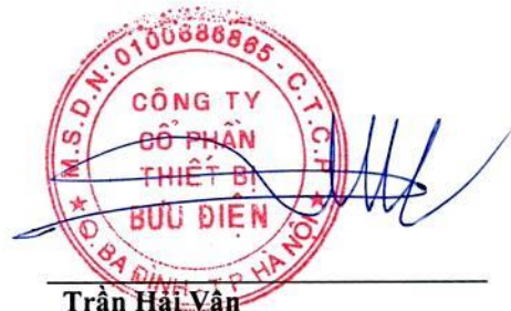
Trần Hải Vân Chủ tịch Hội đồng quản trị