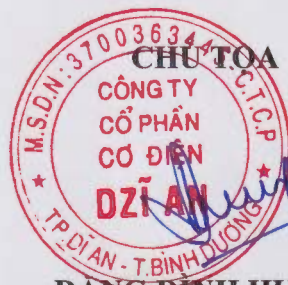
ĐẶNG ĐÌNH HƯNG