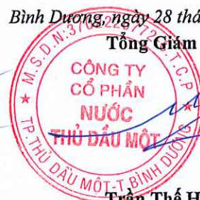
Trần Thế Hưng