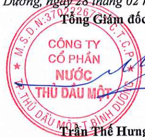
Trần Thế Hưng