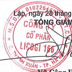
Vũ Công Hưng