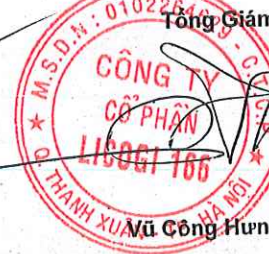
Mũ Công Hưng