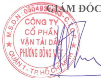
Hồ Sĩ Thuận