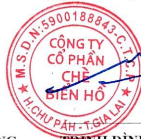
TRỊNH ĐÌNH TRƯỜNG