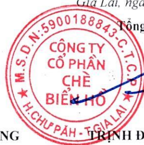
TRỊNH ĐÌNH TRƯỜNG