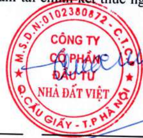
Trần Quốc Huy Chủ tịch HĐQT