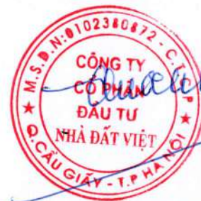
Trần Quốc Huy Chủ tịch HĐQT