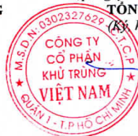
Trương Công Cứ