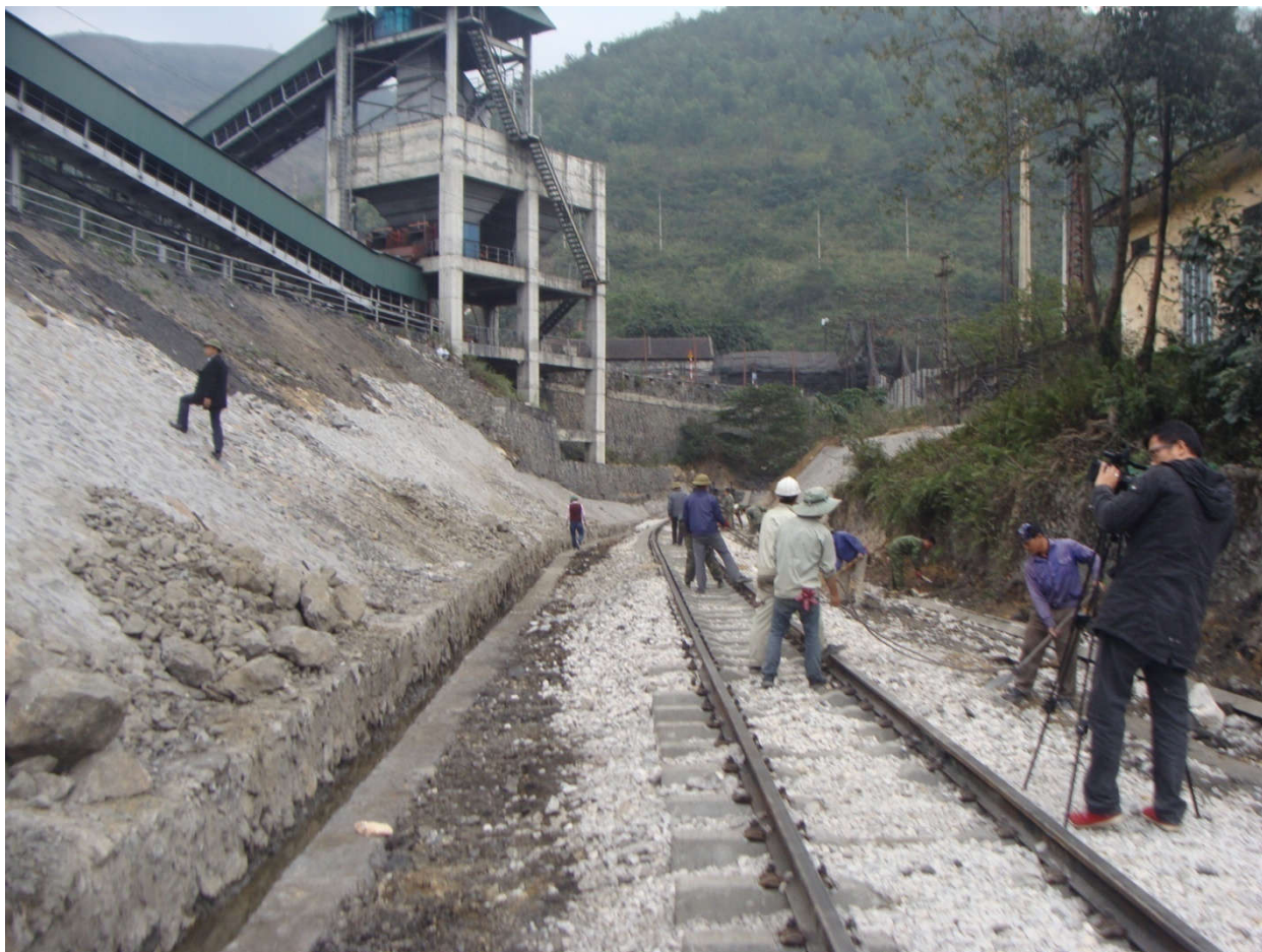
* Hình ảnh thi công công trình đường sắt trên cao Cát Linh Hà Đông 2016: