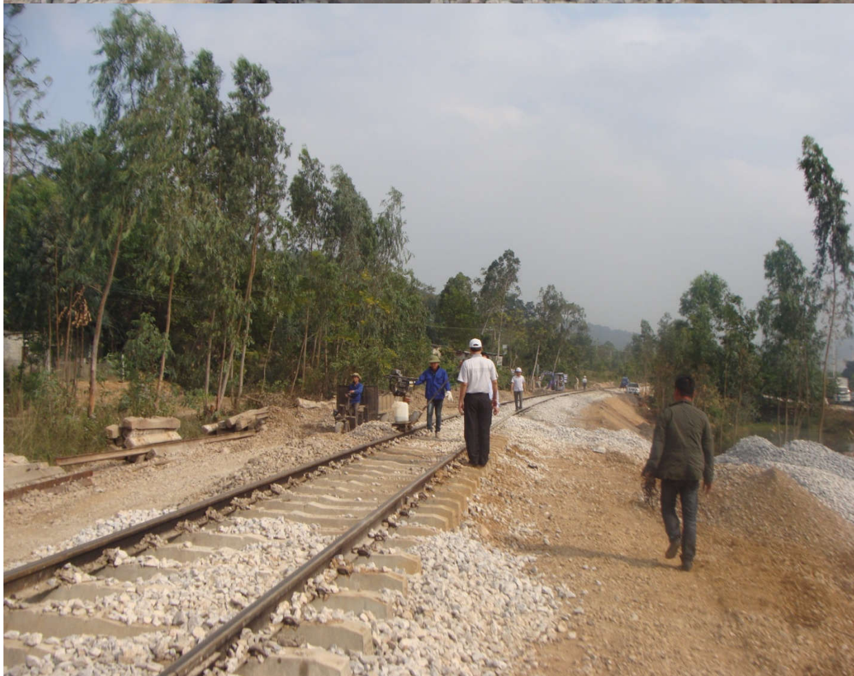
* Thi công công trình đường sắt vào mỏ than Quảng Ninh 2016: